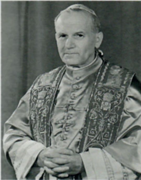
His Holiness Pope John Paul II