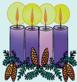
Fourth Sunday of Advent

The incarnation of God in Jesus is far from triumphalism, today's Gospel narrates. That is why the tremendous mistake of Mary's pregnancy was possible: God, in becoming incarnate, also assumed the murky atmosphere of Joseph's suspicion and the risks that she, as an unmarried mother, risked within her Jewish community. All this happened, the Gospel narrates, so that what the Lord had said through the prophet could be fulfilled: "Behold, the Virgin will conceive and bear children: The Virgin shall conceive and bear a son and shall call him Emmanuel, which means, God with us."