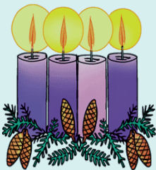
Cuarto Domingo de Adviento

La encarnación de Dios en Jesús está lejos de todo triunfalismo, narra el evangelio de hoy. Por eso fue posible el tremendo equivoco del embarazo de María: Dios, al encarnarse, asumió también el turbio ambiente de la sospecha de José y los riesgos que Ella, como Madre soltera arriesgo dentro de su comunidad judía. Todo esto sucedió narra el evangelio para que se cumpliera lo que había dicho el Señor por el profeta: “Mirad: La Virgen concebirá y dará a luz un hijo y le pondrá por nombre Emmanuel, que significa, Dios con nosotros”.